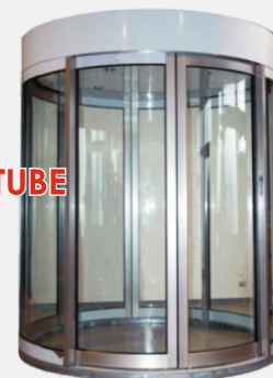
BC 30/A - BIG-TUBE *Alluminium Version

Минимальное время работы аккумулятора - 1 часа Внешнее питание - 220+110V ac50-60Hz Энергопотребление - 300 Вт Вес - *900 – 1800 кг Температурный диапазон - -10/+55°C Пропускная способность - 4/6 чел. /мин.